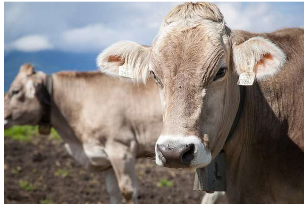
La Brune des Alpes