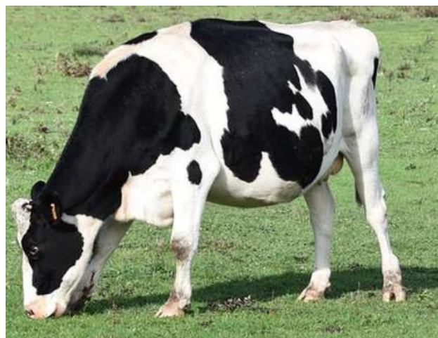
La Pie Noire Bretonne, plus petite que la Prim'Holstein